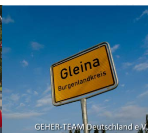
Nächstes Jahr wird die Gleinaer Schleife 30!