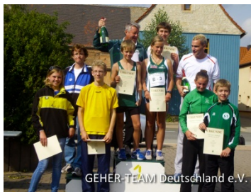
Teamwertung des Schülercups: SV Halle, vor der LG Vogtland und des PSV Berlin