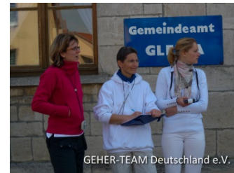
Die Teilnehmer bei der Arbeit